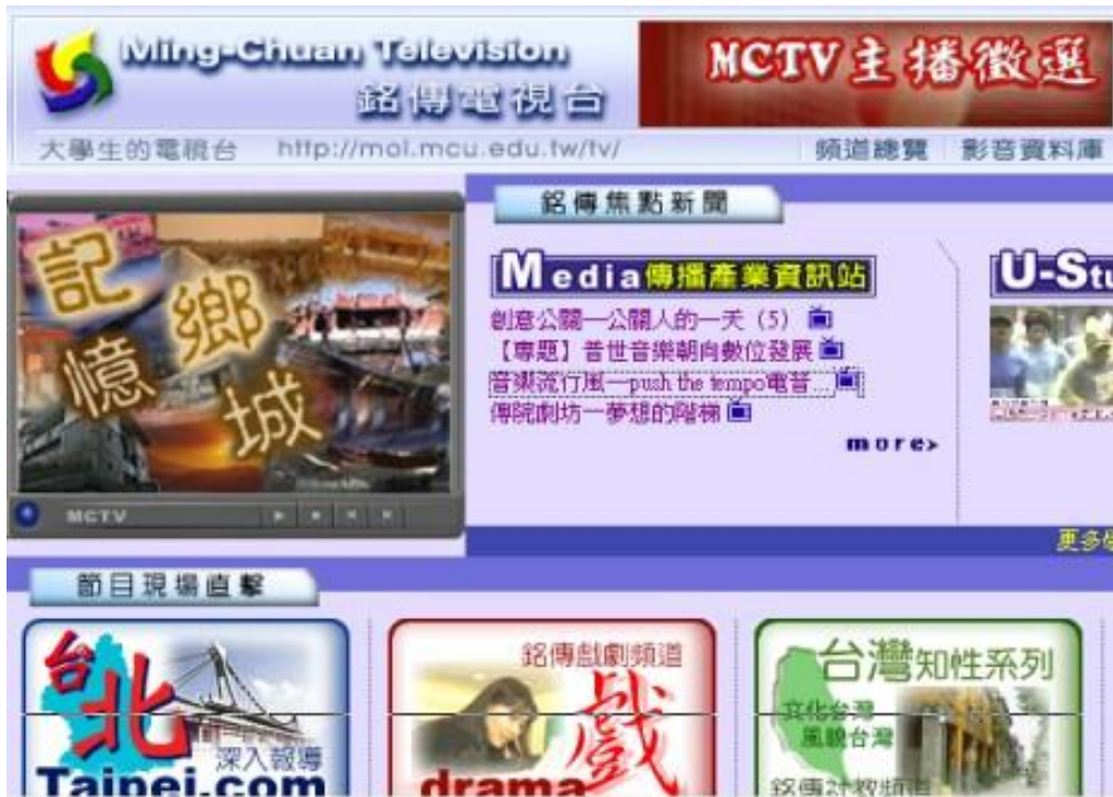
圖-5：網路電視台系統