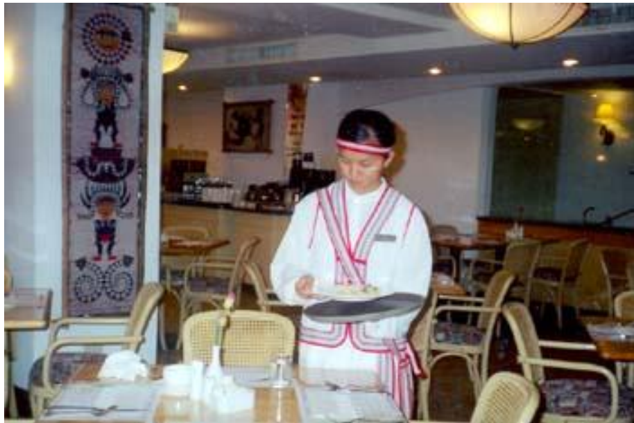
圖-4-1：觀光學院學生實習情形