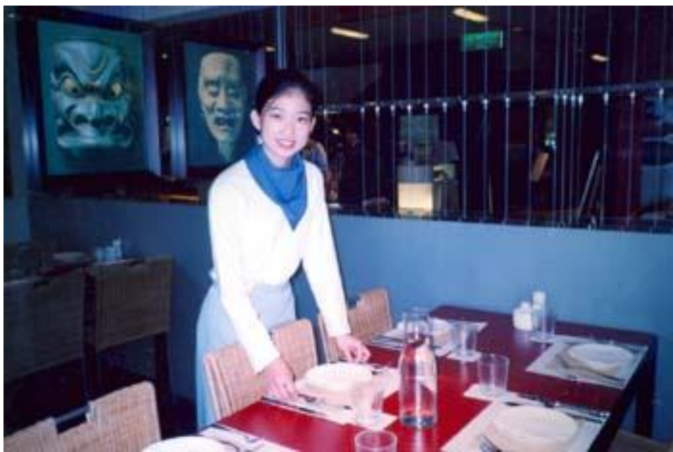
圖-4-2：觀光學院學生實習情形