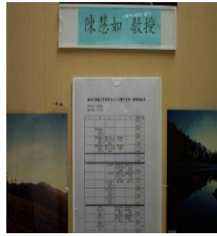
研究室大門、教師留校時間表